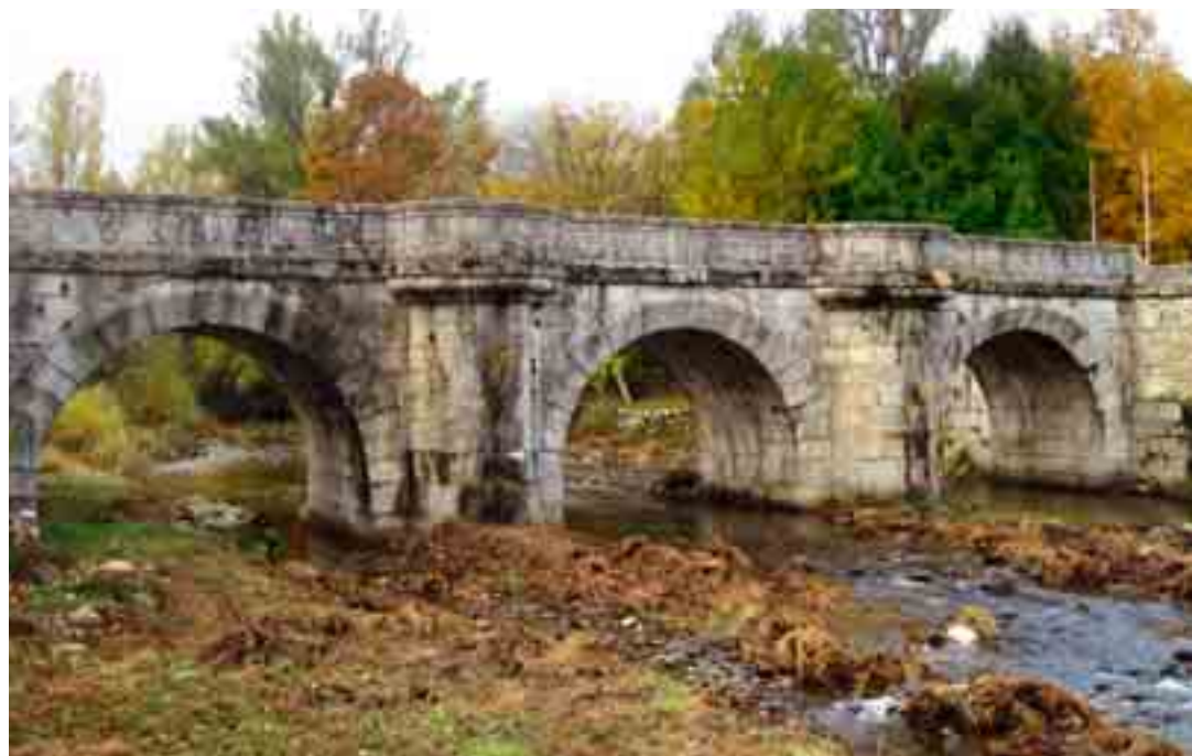
... Puente del Perdón

Vista del valle en primavera desde el Camino Natural que lo recorre