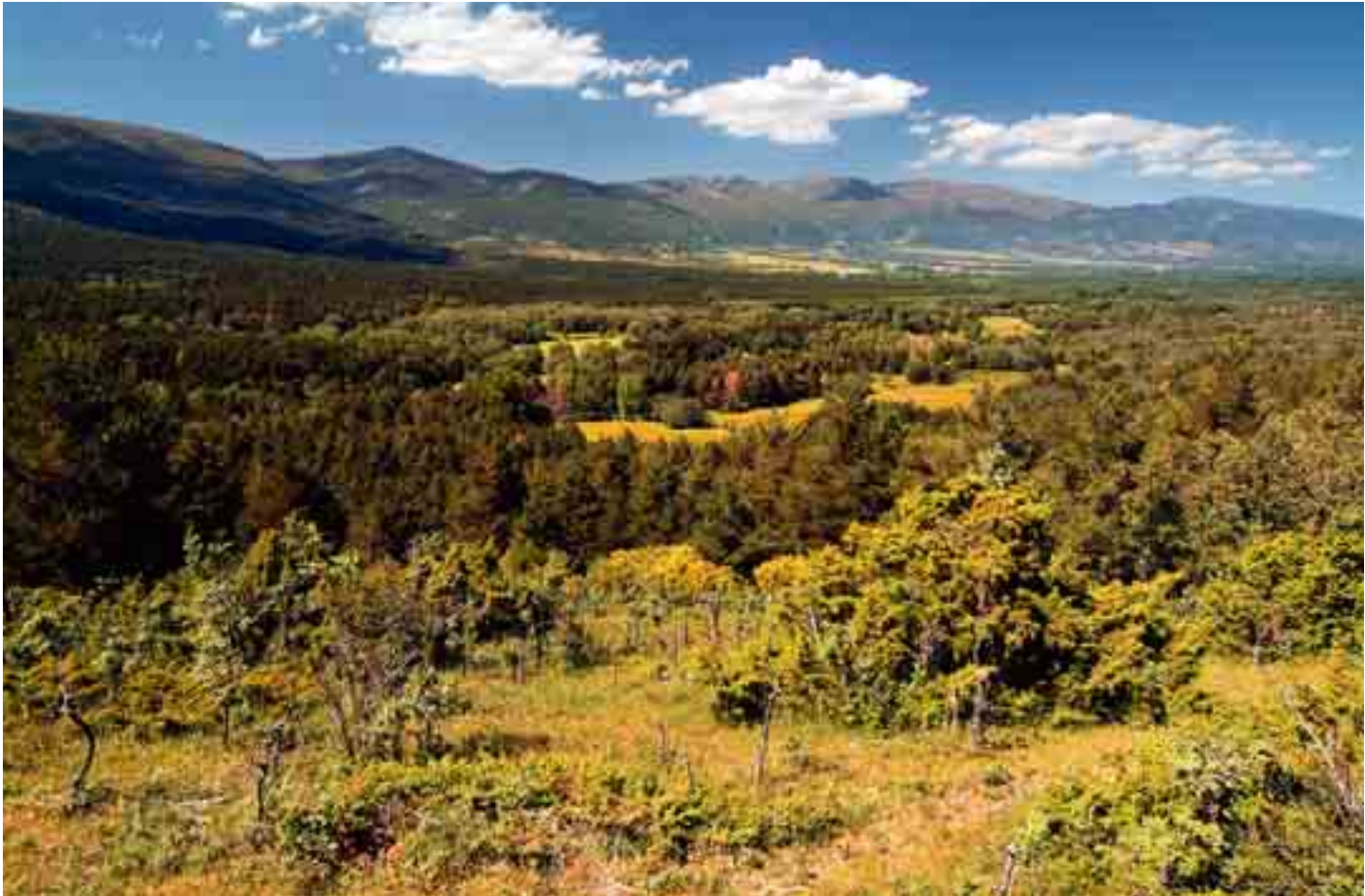
... Valle de Lozoya

Vista del valle en primavera desde el Camino Natural que lo recorre