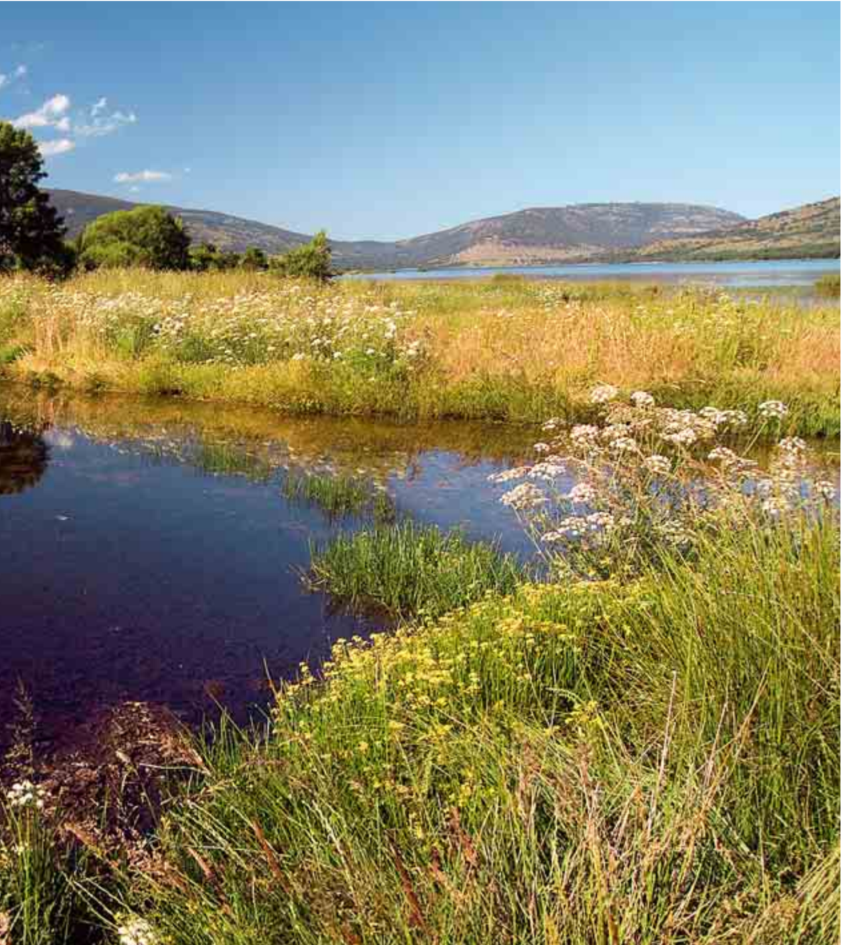
*** Embalse de Pinilla