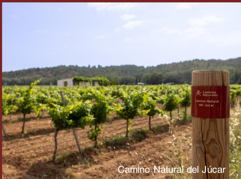
Camino Natural del Júcar