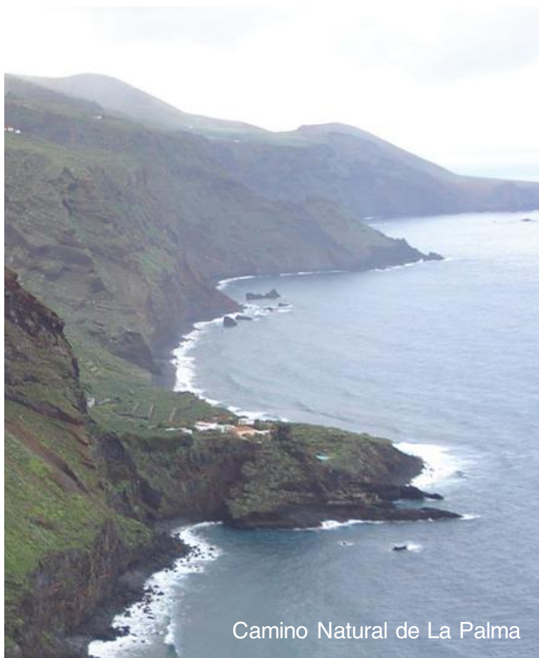
Camino Natural de La Palma

El Parador de La Palma , situado en Breña Baja, se asoma al océano entre jardines de palmeras y plantas tropicales, convirtiéndose en un punto ideal para explorar los senderos de la isla y disfrutar de sus cielos estrellados, considerados entre los mejores del mundo para la observación astronómica.