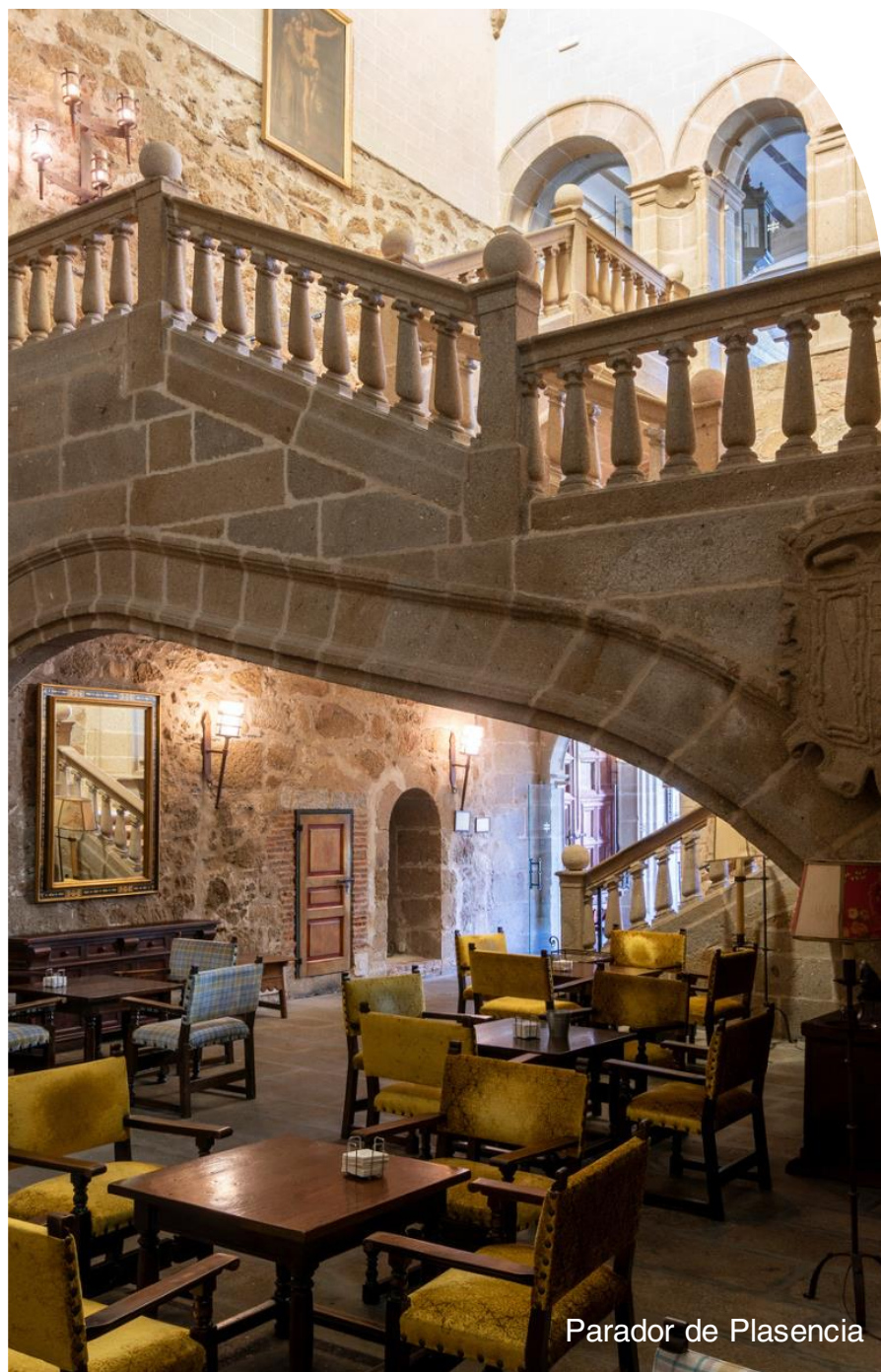
Parador de Plasencia

Continuamos hacia el interior de la península, llegando hasta el Parador de Plasencia , situado en el antiguo convento de San Vicente Ferrer , dentro del conjunto monumental de la ciudad. Desde aquí parte la primera etapa, hacia Jarilla, del Camino Natural Vía de la Plata , que toma su nombre de la denominación popular que durante la Edad Media acabó recibiendo la antigua calzada romana que unía Mérida y Astorga.