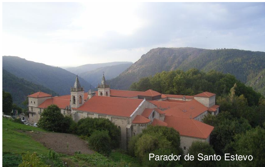
Parador de Santo Estevo

El edificio ha evolucionado hasta convertirse en un Parador que conjuga el turismo moderno con la paz absoluta de su valle recóndito, protegido bajo la declaración de Monumento Histórico Artístico desde 1923.