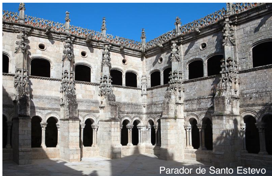
Parador de Santo Estevo

La historia del cenobio quedó sellada por el exilio de nueve obispos en el medievo, cuya presencia atrajo a miles de peregrinos y dio nombre al claustro más antiguo del monasterio: el de los Obispos, una joya del siglo XIII que aún respira la quietud de aquellos tiempos.