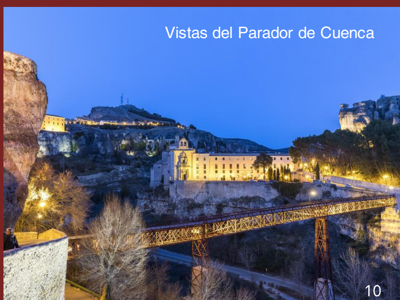
Vistas del Parador de Cuenca