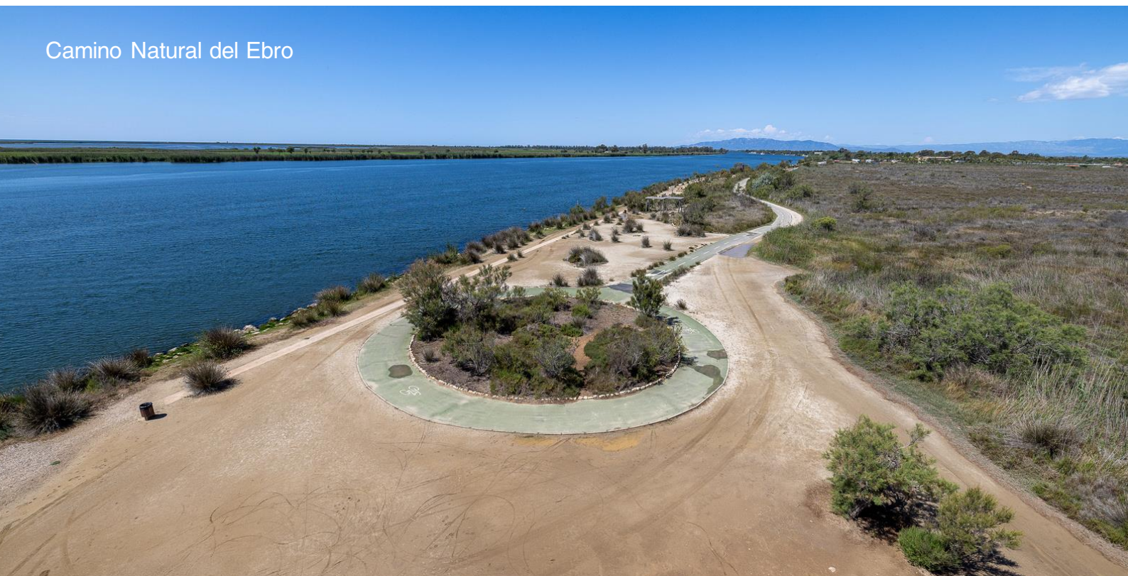
Camino Natural del Ebro