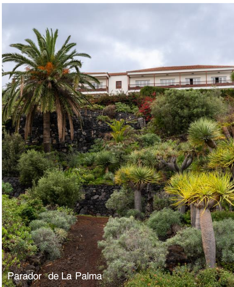
Parador de La Palma