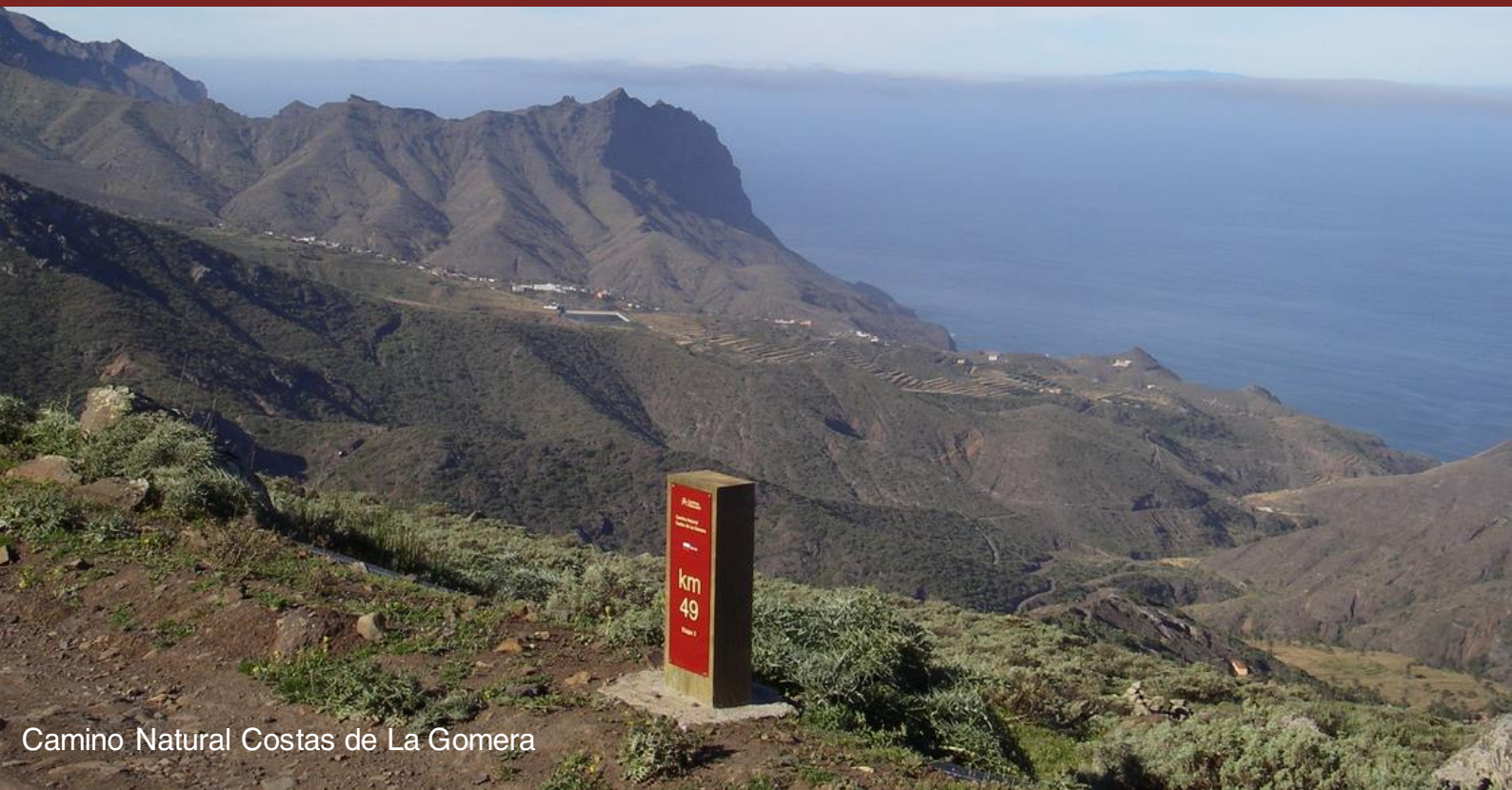
Camino Natural Costas de La Gomera

De norte a sur y de este a oeste, existe un destino compartido entre la tierra que pisamos y los muros que nos dan cobijo. España cuenta hoy con más de 11.000 kilómetros de Caminos Naturales que son, en esencia, una forma de descubrir el territorio paso a paso, dejándose llevar por el susurro de antiguas vías ferroviarias, el eco de sendas históricas o el fluir de rutas fluviales que serpentean por los paisajes más singulares de nuestra geografía. Un viaje al corazón de nuestras costumbres, de nuestros pueblos y la pureza de sus horizontes.