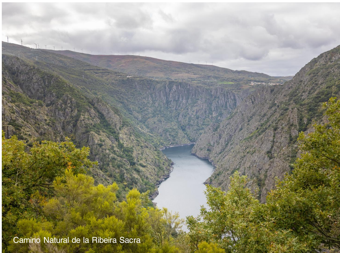
Camino Natural de la Ribeira Sacra

En el corazón de la Ribeira Sacra, donde los ríos Miño y Sil excavan profundos cañones entre montañas cubiertas de viñedos, el Camino Natural de la Ribeira Sacra discurre por antiguos senderos monásticos y miradores naturales.