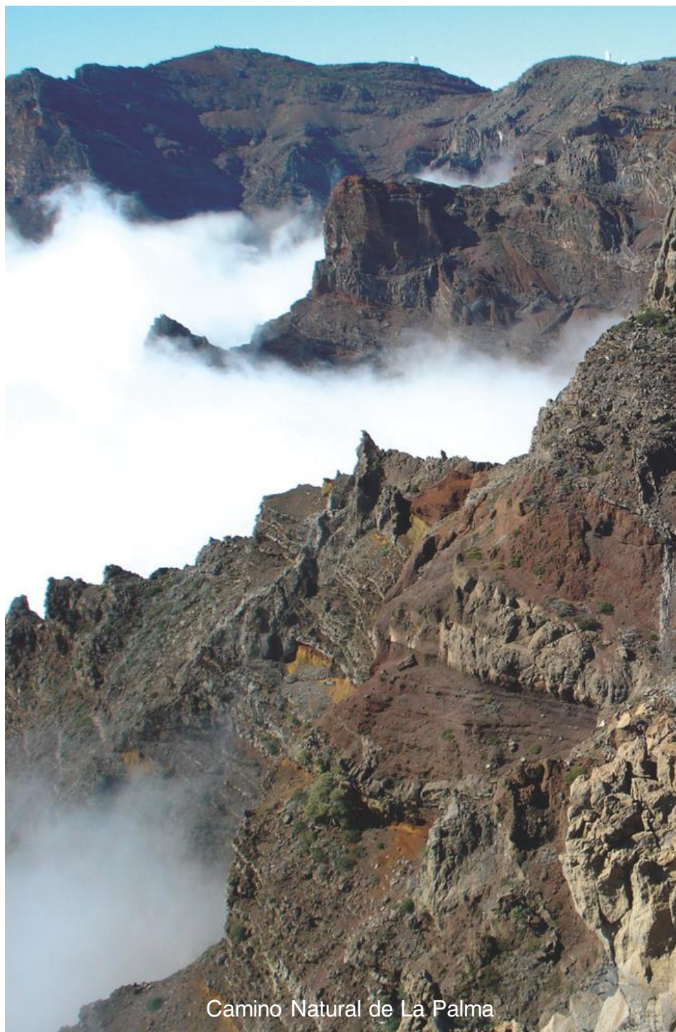
Camino Natural de La Palma

Desde las cumbres volcánicas que desafían al Atlántico hasta los olivares infinitos que pintan de plata el interior, nos embarcamos en un viaje conjunto que nos permitirá descender por ríos y valles o cruzar dehesas para terminar frente al mar. Es la promesa de una experiencia inolvidable: la posibilidad de caminar por la Historia y descansar en ella, uniendo el desarrollo de dos redes que juntas suman más de un siglo de vida y siguen apostando por un futuro verde y lleno de cultura.