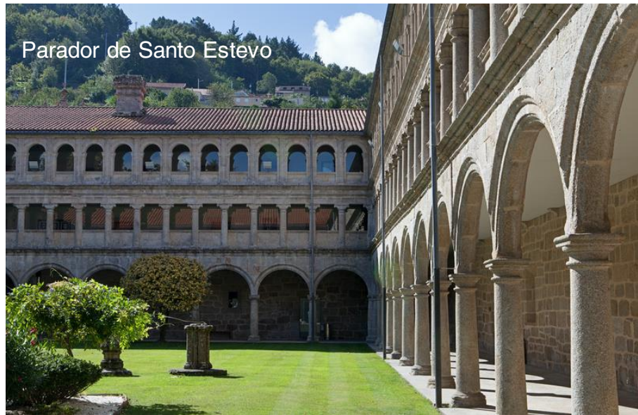
Parador de Santo Estevo

Las raíces de este cenobio se hunden en el siglo VI, vinculadas a la figura de San Martín Dumiense, conocido como el 'Apóstol de los suevos'.