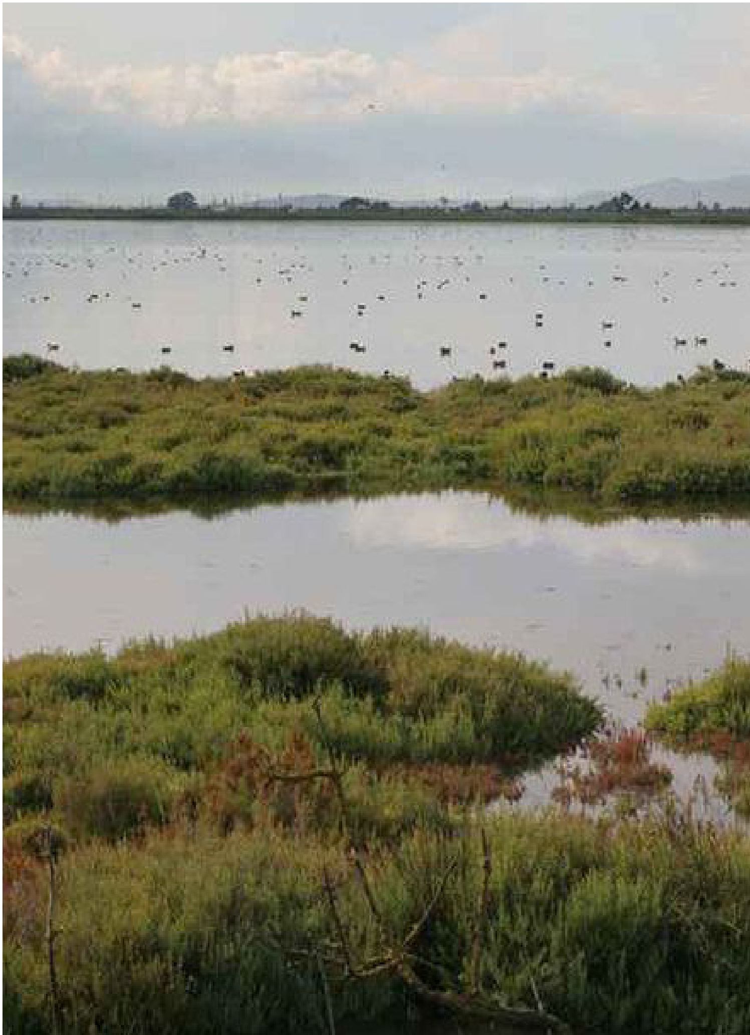
Delta del Ebro