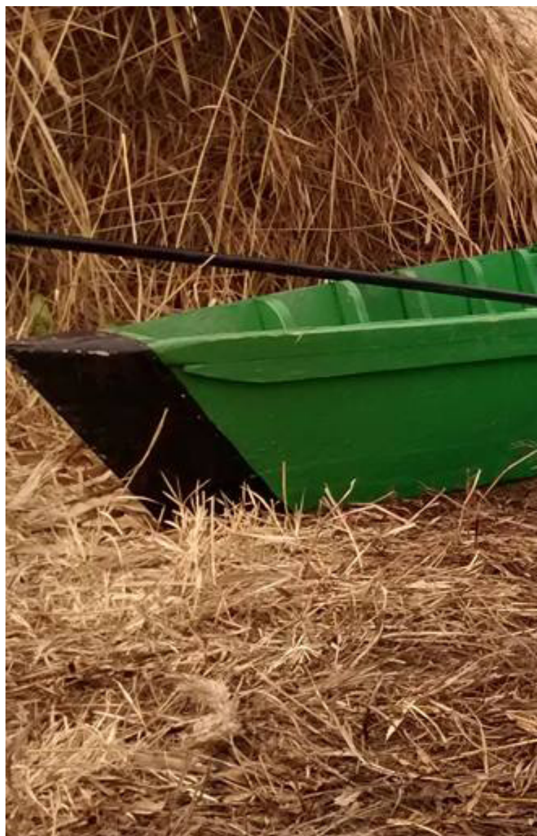
Tablas de Daimiel

A caballo entre las provincias de Cuenca, Ciudad Real y Toledo, en pleno corazón de la región