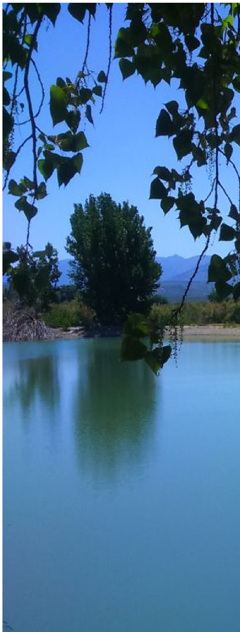
Paraje Natural Laguna Grande

El caminante encontrará el punto final de este recorrido en un área de descanso situada en el paraje de Horcajo (Begíjar), donde podrá reponer fuerzas y disfrutar de un paisaje plagado de olivos. A tan solo 10 km en coche del municipio de Begíjar se encuentra el humedal más importante de la provincia de Jaén. Se trata del Paraje Natural Laguna Grande , cuyo origen está ligado indefectiblemente con la tierra que lo rodea, ya que fue el hombre el que, aprovechando un pequeño humedal ya existente, impulsó la creación de este paraje para regar los inmensos campos de olivo contiguos. La laguna se nutre de las aguas del Río Torres mediante canales de riego. Su carácter permanente hace que cobre especial importancia para la fauna de la zona, ya que en los meses de estío, cuando el resto de lagunas naturales de la provincia se encuentran secas, aves como la cerceta común, ánade real o el porrón común, encuentran en Laguna Grande un lugar idóneo para refugiarse. En las inmediaciones de la laguna se ubica el punto de información Laguna Grande, que ofrece al visitante información amena sobre los valores naturales que ofrece este espacio.