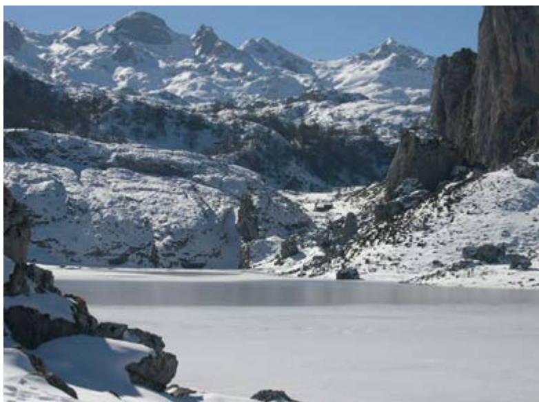
Parque Nacional de Picos de Europa

De igual forma, y sin salir de la península ibérica, encontramos en Extremadura el Camino Natural del Tajo que, a lo largo de un tramo continuo de alrededor de 18 kilómetros, atraviesa de este a oeste la parte norte del impresionante Parque Nacional de Monfragüe o el Camino Natural de la Cañada Real Soriana Occidental y del Guadiana , que discurren por los privilegiados límites de los Parques Nacionales de la Sierra de Guadarrama, en su vertiente segoviana, y de las Tablas de Daimiel, respectivamente.