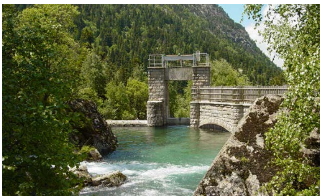
Parque Nacional de Aigüesortes

alcanza en un duro ascenso durante su primera etapa el punto más alto de la isla, con 2.426 metros de altitud, dentro del Parque Nacional. La “isla bonita” fue declarada Reserva de la Biosfera en 2002, pues además del Parque Nacional alberga también dos Parques Naturales, el Parque Natural de la Cumbre Vieja y el Parque Natural de las Nieves.