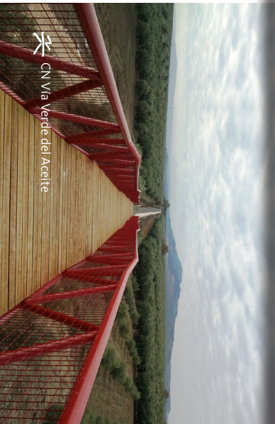
CN Vía Verde del Aceite

Vía Verde de La Sierra (Cádiz). Este recorrido atraviesa los 29 túneles excavados en el corazón de la sierra gaditana para el trazado ferroviario que pretendía unir Jerez de la Frontera y Almargen, y que la Guerra Civil impidió finalizar. El más largo de esos túneles, ubicado al final de la ruta, mide casi 500 m. Pueblos blancos, olivares, reses bravas, la Reserva Natural Peñón de Zafra magón, megalitos y ríos santuario de la nutria salpican una ruta de 35,5 km.