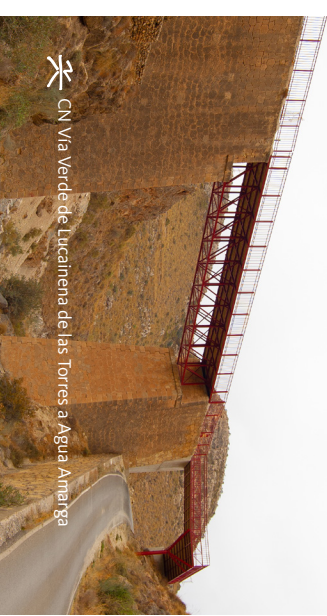
CN Vía Verde de Lucainena de las Torres a Agua Amarga