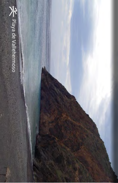
Playa de Vallehermoso