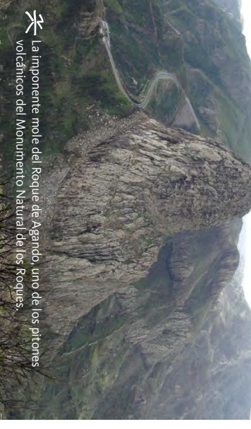
La imponente mole del Roque de Agando, uno de los pilones volcánicos del Monumento Natural de los Roques.