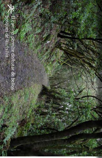
El camino permite disfrutar de bellos bosques de laurisilva.